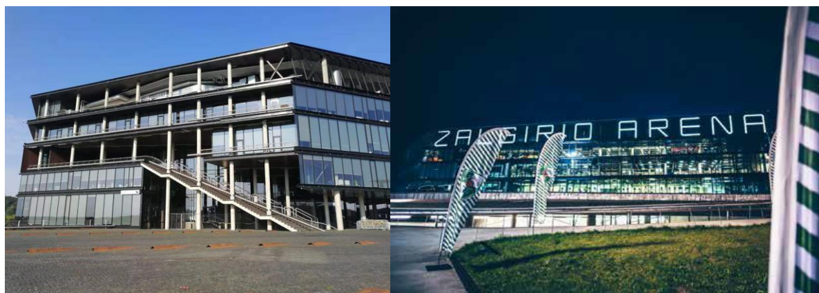
图 1 大会会场——Žalgirio 竞技场

会议关注的问题涉猎广泛，尤其是几个主题报告让人印象深刻，分别针对健康与能源的平衡、健康和可持续性建筑、21 世纪监测暴露的挑战：协调合作和法律要求、保护生态系统服务安全：关注气候变化和水资源供应等主题，既通过发展过程的剖析论述了取得的成果，也对前沿问题进行了深入浅出地展望。在会上，我们发表的“节律协同与室内环境相关问题的思考”和“中国居住建筑室内环境对健康的影响——横断面调查研究”也引起了与会代表的兴趣，并进行了交流。